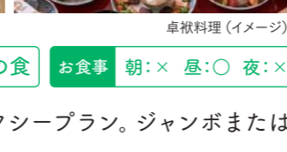
卓袱料理 (イメージ)