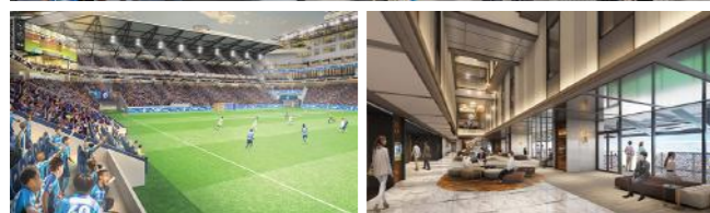
今後、デザイン含め変更の可能性があります。