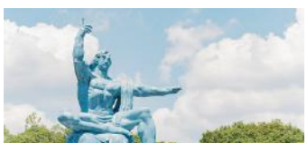
平和公園 (イメージ)