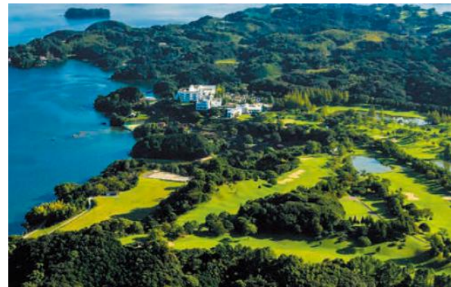
パサージュ琴海アイランドゴルフクラブ (イメージ)