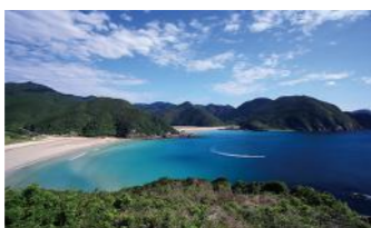
高浜海水浴場(イメージ)

長崎県は離島の数がNO.1として知られています。ジェットfoilを利用して五島列島の福江島を訪れ、美しい海岸の景色や、海の幸、山の幸を五感でお楽しみいただけます。