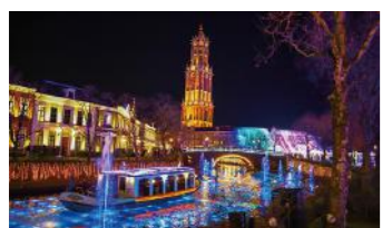
ハウステンボス(イメージ)