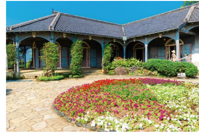
グラバー園(イメージ)