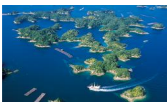
九十九島(イメージ)

日本最大のテーマパーク「ハウステンボス」では光り輝くイルミネーションがみどころ。園内散策やアトラクションも体感いただけます。絶景九十九島、佐世保の歴史、佐世保バーガーと盛り沢山!