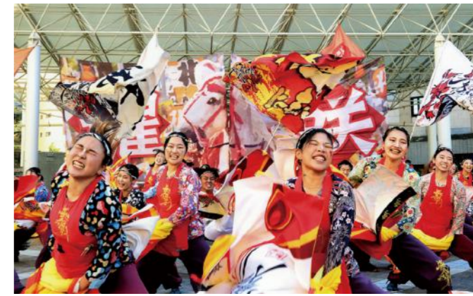
YOSAKOIさせば祭り

全国各地の「まつり・イベント」は、コロナ禍により中止を余儀なくされたほか、昨今では、担い手不足、協賛金の減少やコスト増などの課題が顕著となり、「まつり・イベント」の継続に向けた新たな対応が求められているところです。