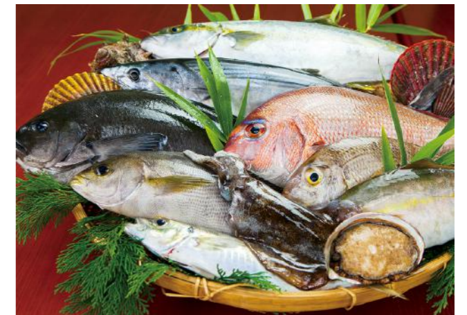
長崎県の新鮮な魚

分科会においては、観光との連携強化による地場産業の活性化や身近な地域資源の活用への取り組みなどを紹介し、「食」を活用した観光まちづくりについて考えます。