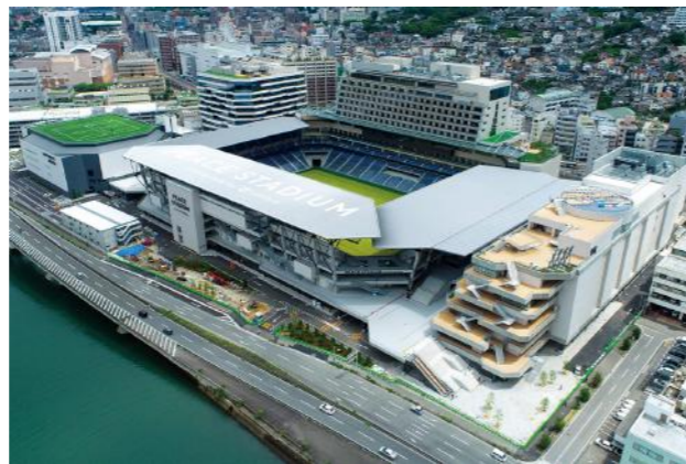
長崎スタジアムシティ(2024年10月開業)

分科会においては、長崎地域や全国で展開されるスポーツイベントなどを参考に、スポーツによる観光まちづくりについて考えます。