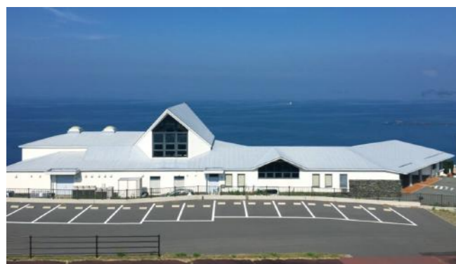
長崎市遠藤周作文学館 (イメージ)