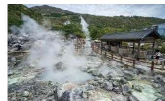
雲仙地獄 (イメージ)