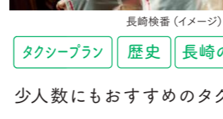
長崎検番 (イメージ)