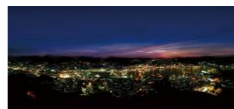
稲佐山からの夜景 (イメージ)