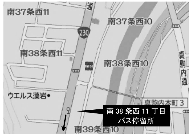
◆【南38条西11丁目 停留所(石山通)】