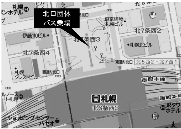
◆【JR札幌駅北口団体バス乗場】