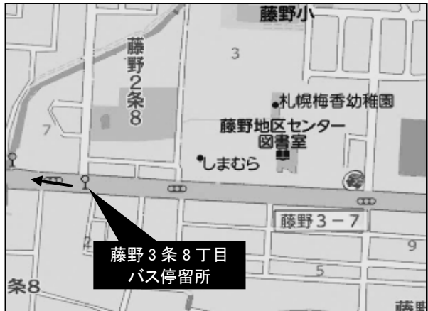
◆【藤野3条8丁目 停留所(石山通)】